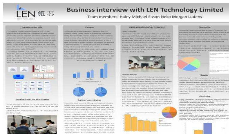
商务采访课程学生制作的汇报海报

在商务采访模块中，采取实地研究项目法，每 4-6 名学生组成一个小组，分工合作完成商务采访，包括邮件和电话联系选定受访公司、确定采访重点和访谈提纲，对公司管理人员进行访谈，撰写相应调研报告、通过海报展示研究过程并进行答辩，鼓励学生在一线了解企业运营管理。全过程用英语完成，并由学生主体进行“前台展示”，教师团队为支撑进行“后台指导”。在跨文化沟通模块中，设置不同的模拟情境，引导学生理解在不同的场景中如何使用英语进行沟通交流，将听、说、读、写、译运用到跨文化交流的各个环节，有效避免东西方文化差异对双方交流的影响，提升学生跨文化交流的自信。在求职艺术模块中，凸显学生未来职业发展导向，指导学生用英语撰写求职信、设计制作简历、掌握面试礼仪，强化英语语言在实际求职环境中的运用。