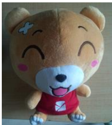
易班吉祥物——易班熊公仔