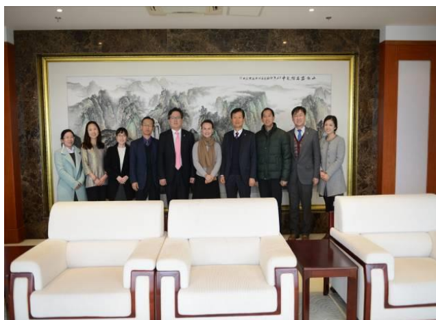
学院领导、韩语系教师与韩亚银行上海分行代表合影