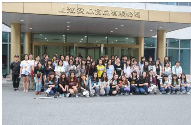
上海农心食品有限公司前合影