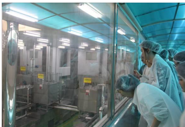
参观上海农心食品有限公司辛拉面生产线