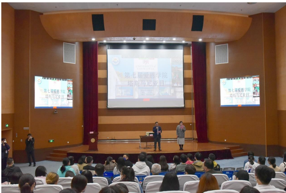
第七届塔斯马尼亚日

为了增进上海海洋大学和塔斯马尼亚大学之间的联系，加强学生对塔斯马尼亚大学的了解，促进文化碰撞与交流，学院会定期举办“塔斯马尼亚日”活动。在活动中，将展示塔斯马尼亚大学的地理环境、学科特色和丰富的研究成果。塔斯马尼亚大学的天然资源、自然气候、地理环境和生态环境俱佳，为学生提供了便利的科研条件，有助于学生全面发展。活动还会每年抽取幸运锦鲤送上塔大老师们精心准备的礼物！学生不出校门就能身临其境地感受塔大风采，拓展国际视野。