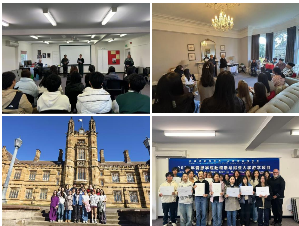
2024年暑期爱恩学院赴塔斯马尼亚大学短期学习项目

学院已经举办多年举办赴澳洲短期学习项目，短期学习项目的内容主要包括：走进塔斯马尼亚大学的课堂，参加专业课程学习；参加英语学习方法、创新创业讲座；学习和了解塔大对留学生的教学管理、教学支持与服务；与在塔大的爱恩学长会面，交流沟通学习生活经验；走访澳洲名校和企业等，了解澳洲当地的文化等。