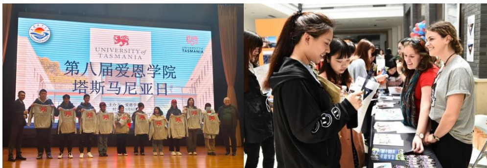
塔斯马尼亚日活动现场

为了增进上海海洋大学和塔斯马尼亚大学之间的联系，加强学生对塔斯马尼亚大学的了解，促进文化碰撞与交流，学院会定期举办“塔斯马尼亚日”活动。“塔斯马尼亚日”作为两校文化交流的品牌活动，自2016年以来已连续举办8届，为海大学子深入了解塔斯马尼亚大学和澳洲提供了很好的平台和窗口。在活动中，邀请塔斯马尼亚大学领导、老师详细讲解塔斯马尼亚大学办学历程和教育特色、两校合作办学项目的发展历程、课程设置有和教学特色等，帮助同学们更加清晰地了解塔斯马尼亚大学的教育体系、办学优势、专业特色。同时，活动还会邀请优秀校友分享他们在塔斯马尼亚大学的学习收获和生活体验，为同学们的未来学习规划提供借鉴。活动现场还会抽取幸运锦鲤送上老师们精心准备的礼物！同学们不出校门就能身临其境地感受塔大风采，拓展国际视野。