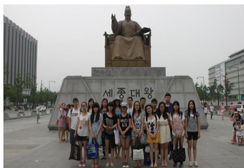
在光化门广场世宗大王像前合影