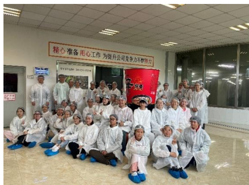
朝鲜语专业学生参观上海农心食品有限公司