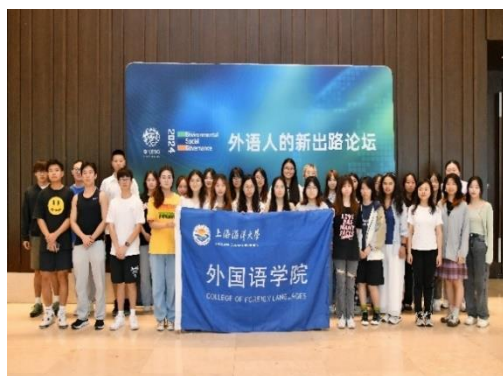
英语专业学生走访新东方国际教育集团及上海策马翻译有限公司