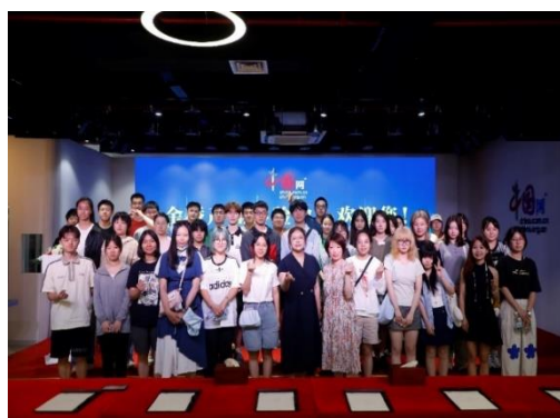
日语专业学生到上海蜜家文化传媒有限公司及上海辉文生物有限公司参观学习