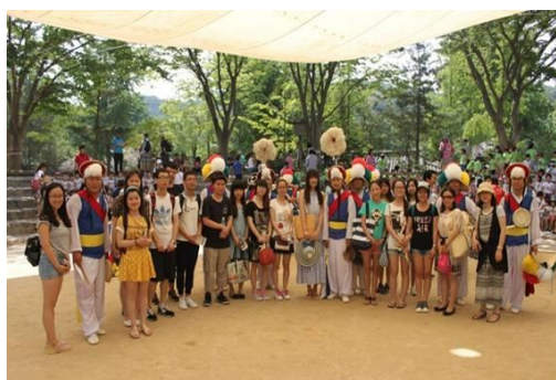
在民俗村同传统舞蹈演员合影